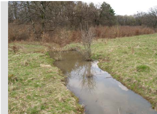
6 Aprilie - 2010