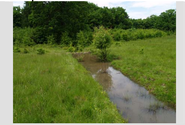
23 Mai - 2010