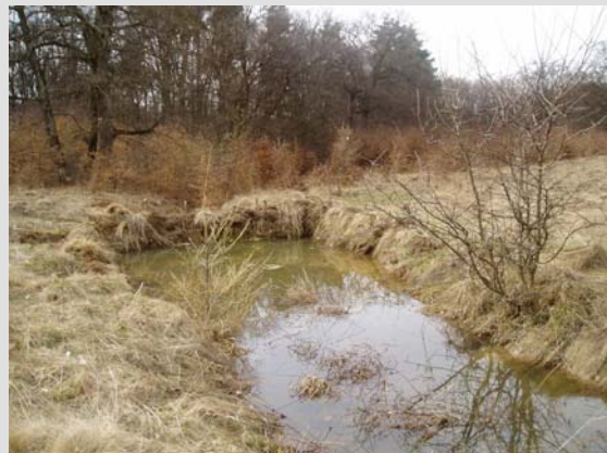
2 Aprilie - 2009