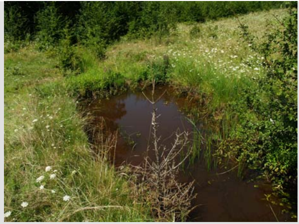
12 August - 2010