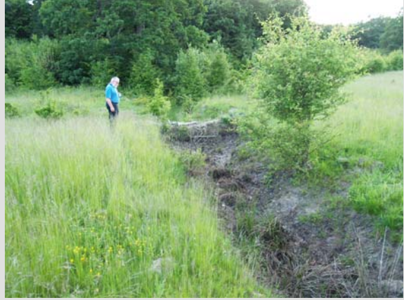
6 Iunie - 2010