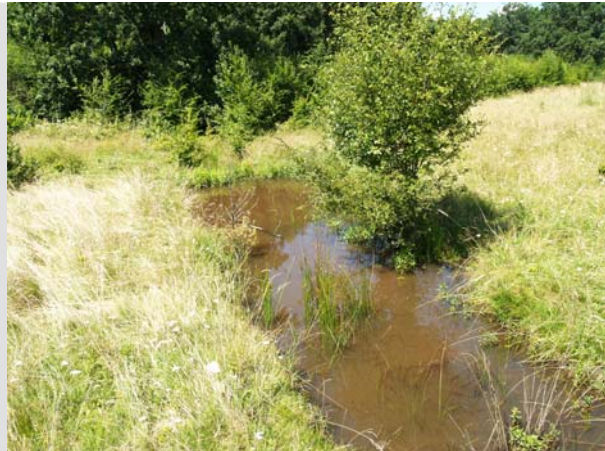
31 Iulie - 2010