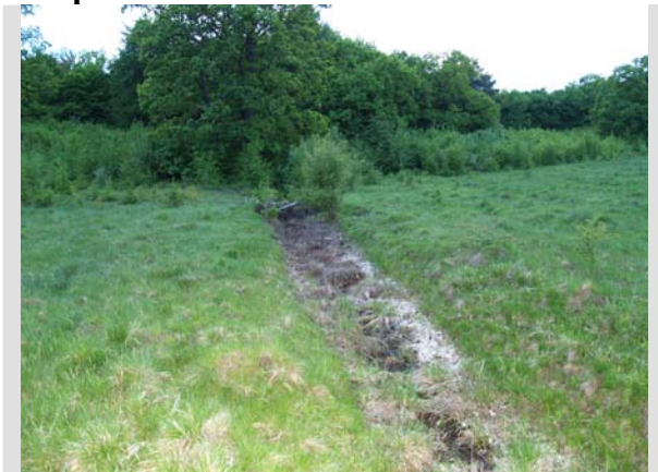
5 Mai - 2010