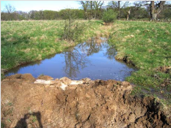
17 Aprilie 2008

Figure 1 – Dynamic of the maximum depth of a wetland newly created after the enclosure of a drainage ditch in 2007. The graph presents the variations for 2010 (the pictures below captures different moments illustrated in the graphic)