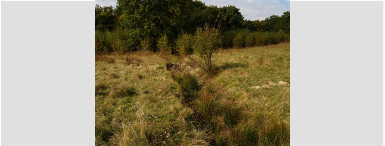
Octombrie 11 - 2010