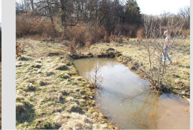
25 Martie - 2010