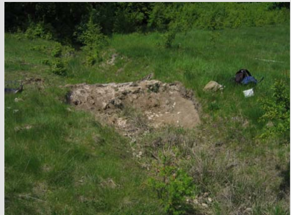
11 Mai 2008