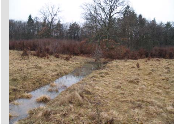
4 Ianuarie - 2010