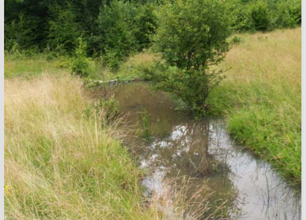
23 Junie - 2010