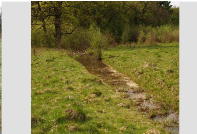
25 Aprilie - 2010